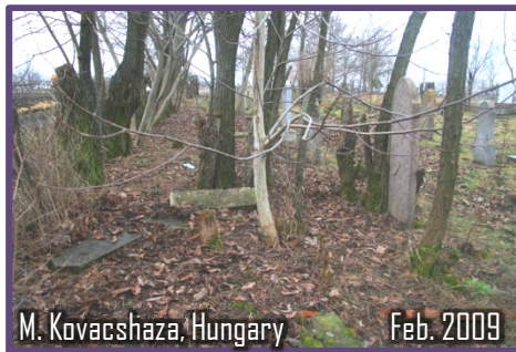
M. Kovacsghaza, Hungary Feb. 2009